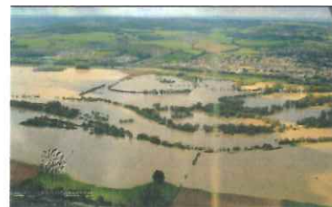
Pagny-sur-Moselle - Crue d'octobre 2006