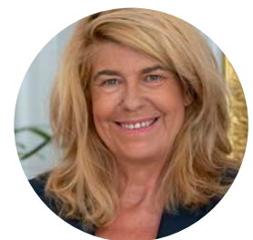
Dominique Faure Ministre déléguée chargée des Collectivités territoriales et de la Ruralité

Parce que je veux que ces solutions soient le plus facilement accessibles et utilisables, ce guide vous donne accès à toutes les informations nécessaires pour inventer, dès aujourd'hui, les ruralités de demain.