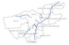
Plan de situation (voie cartographiée en rouge)