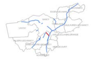
Plan de situation (voie cartographiée en rouge)