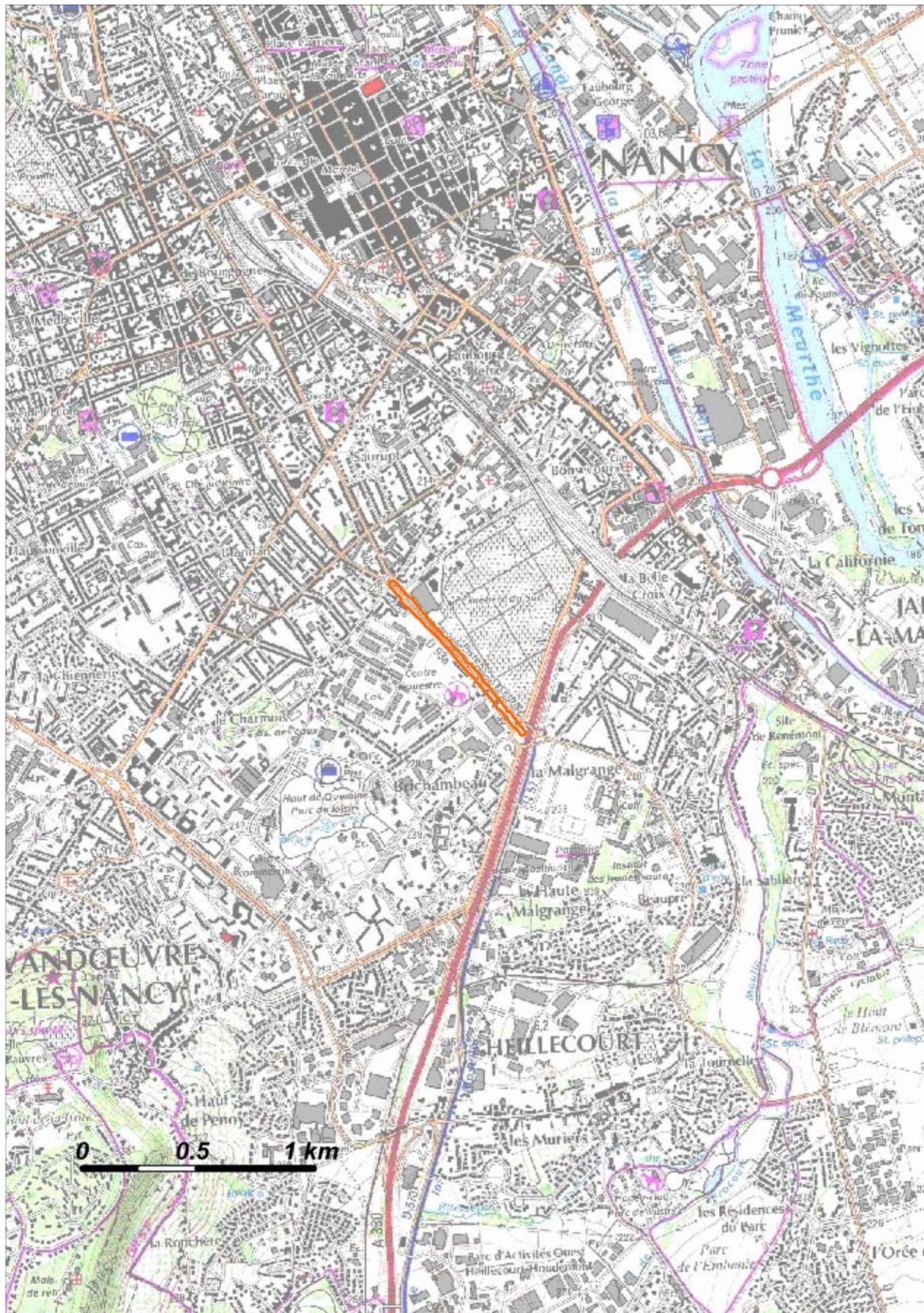
Plan de situation (voie cartographiée en rouge)