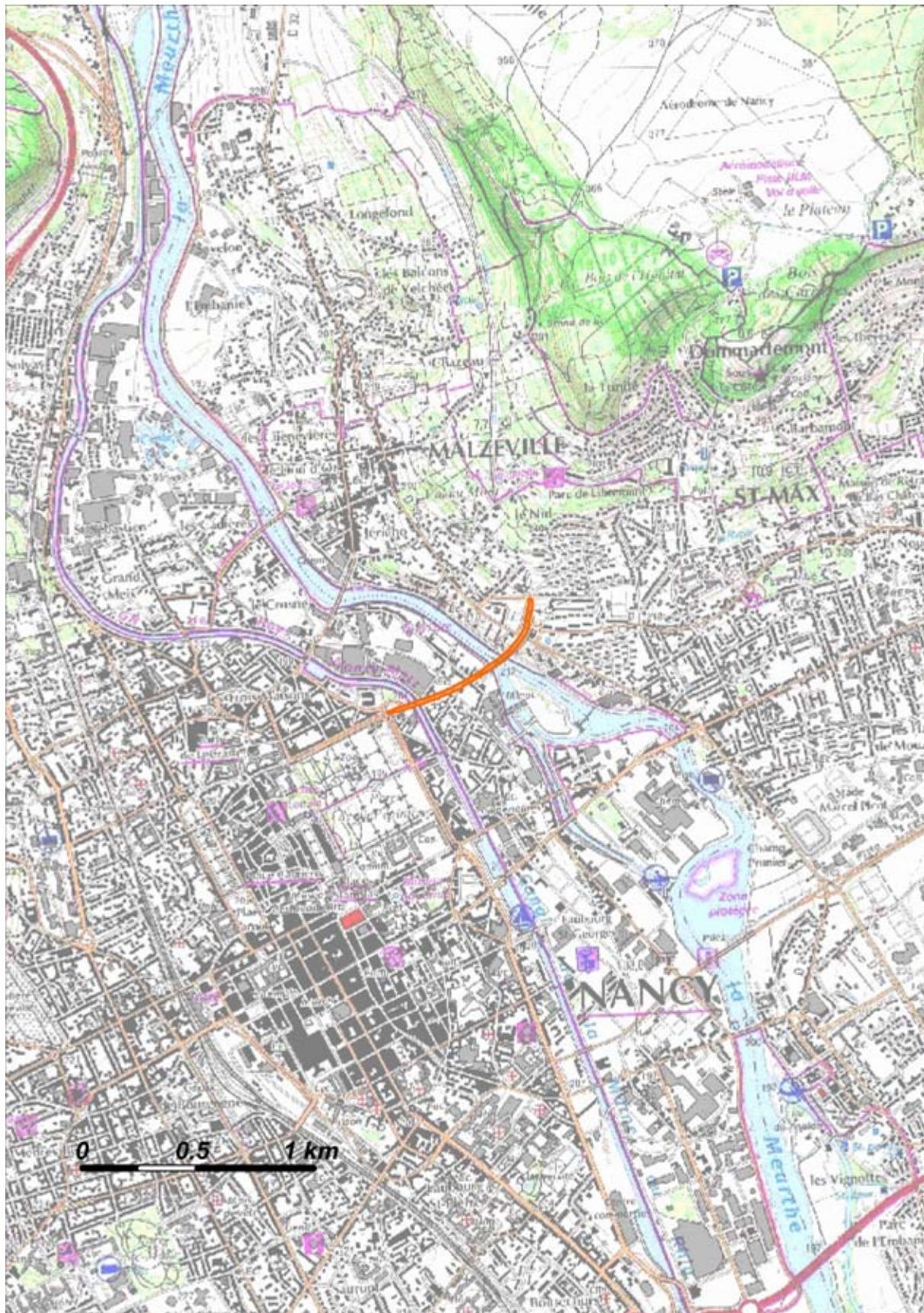
Viaduc Louis Marin Nancy, Saint-Max