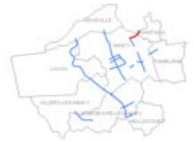
Plan de situation (voie cartographiée en rouge)