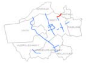
Plan de situation (voies cartographiées en rouge)